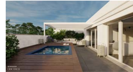
PLANTA ATICO PORTAL 2 PUERTA D