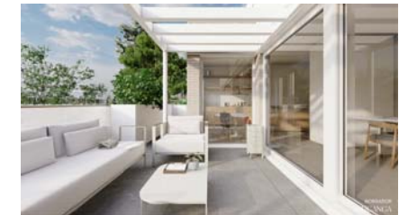
PLANTA RIMERA PORTAL 2 PUERTA B